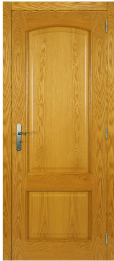
P1RE2AB CARVALHO USA