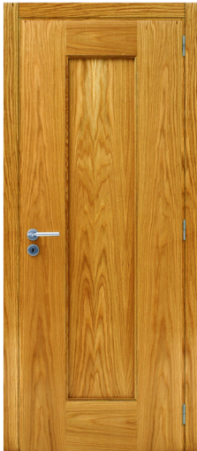
P4LD1AA CARVALHO USA